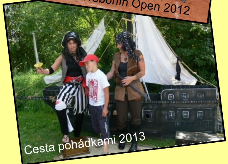
Cesta pohádkami 2013