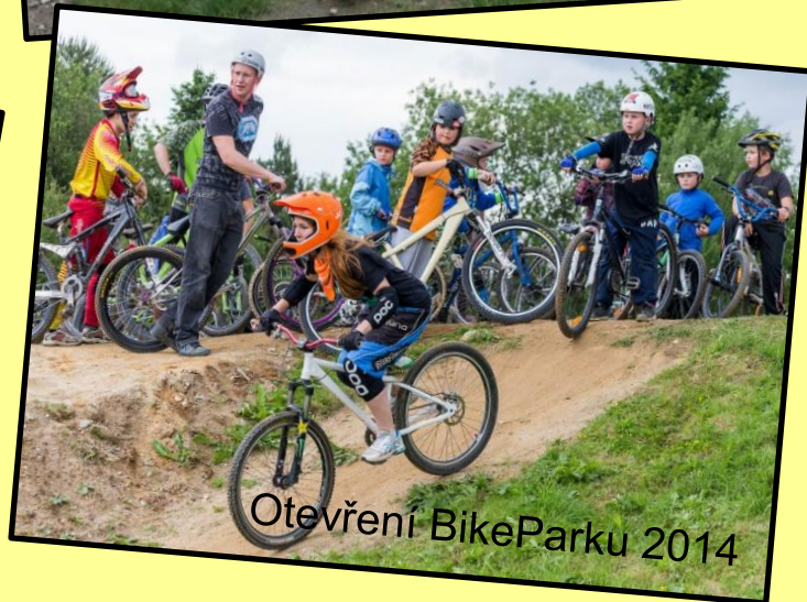
Otevření BikeParku 2014