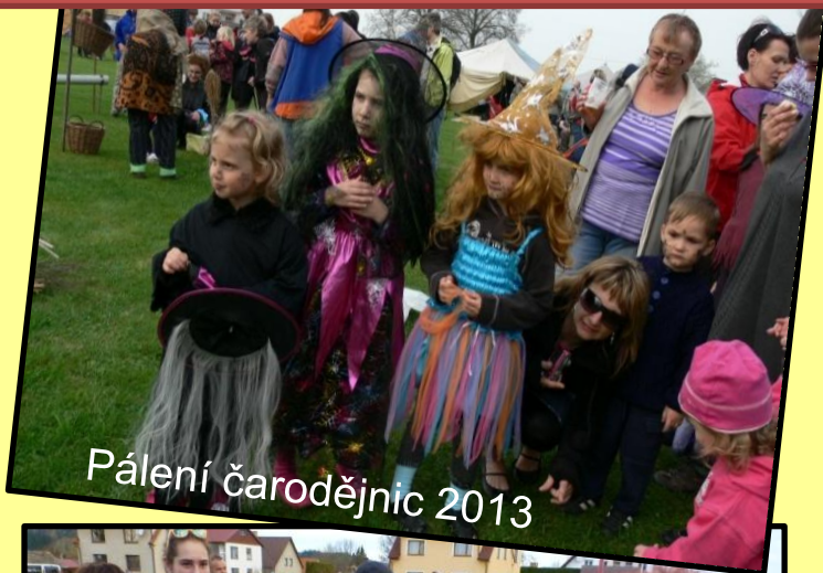
Pálení čarodějnic 2013

... za 4 roky, více než 100 tradičních i netradičních akcí pro Vás