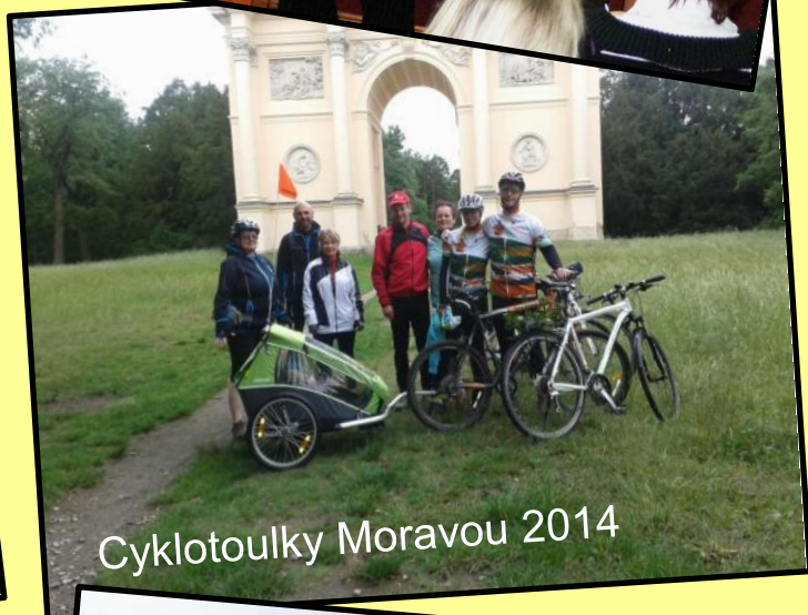
Cyklotoulky Moravou 2014