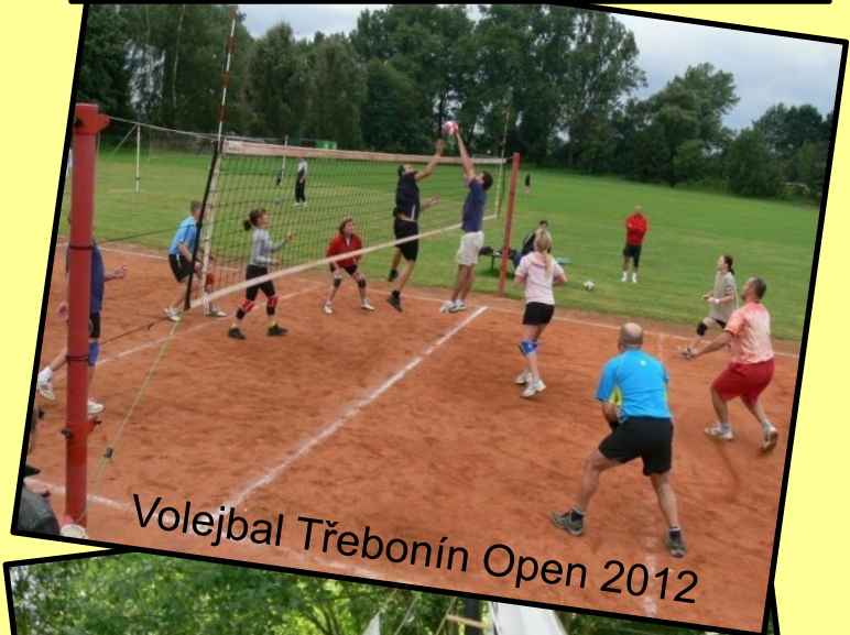
Volejbal Třebonín Open 2012