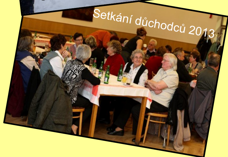
Setkání důchodců 2013