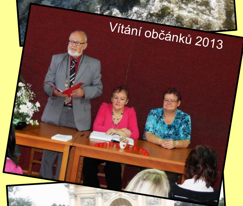
Vítání občánků 2013