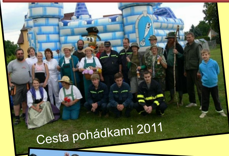
Cesta pohádkami 2011