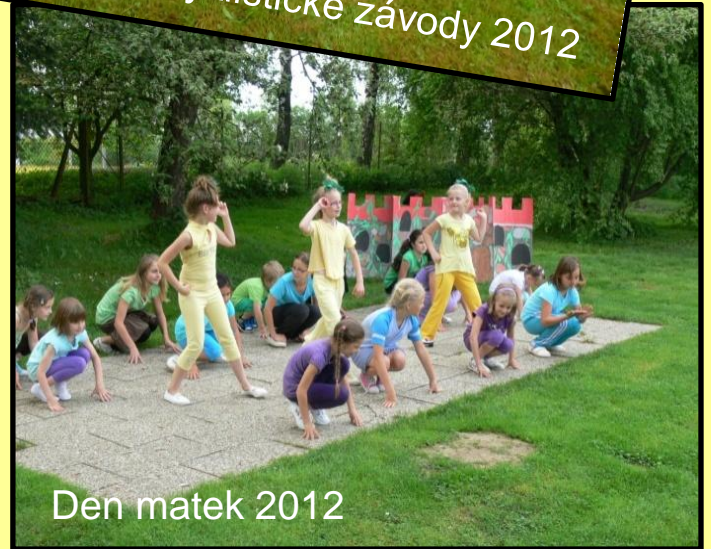
Den matek 2012