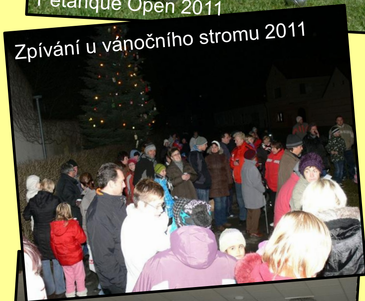
Zpívání u vánočního stromu 2011