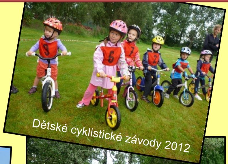
Dětské cyklistické závody 2012