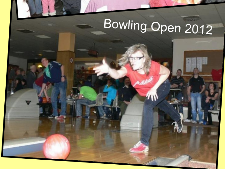
Bowling Open 2012