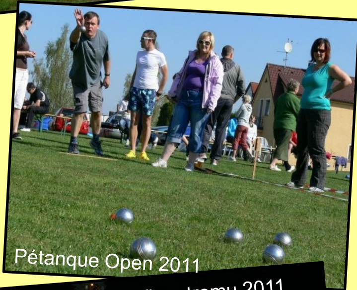
Pétanque Open 2011