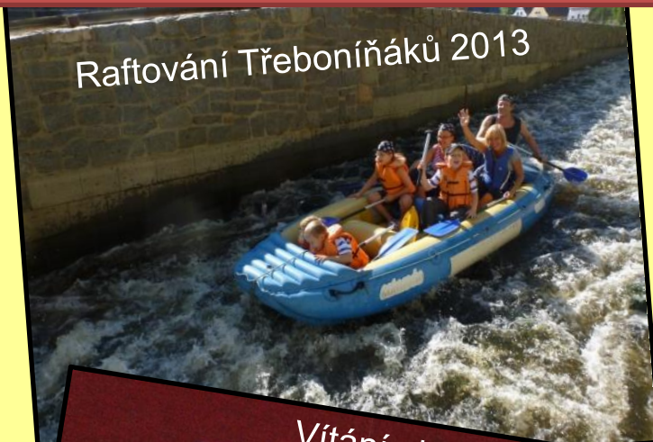
Raftování Třeboniňáků 2013