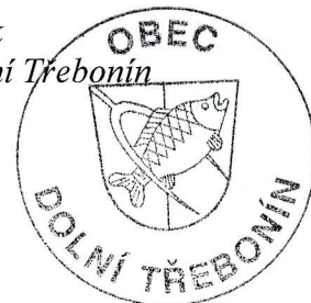
Pavel Ševčík starosta obce Dolní Třebonín

Rada obce tímto zveřejňuje záměr obce prodat pozemek.p.č. 280/4 o výměře 1134 m 2 a pozemek p.č.640/1 o výměře 2061 m 2 , obojí v k.ú. D.Svince.