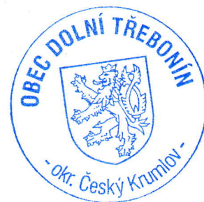
Pavel Ševčík starosta obce Dolní Třebonín

Rada obce tímto zveřejňuje záměr obce pronajmout pozemky p.č. 202/9 o výměře 8m 2 , 206/7 o výměře 1 m 2 , 206/10 o výměře 25 m 2 , 665/9 o výměře 55 m 2 a pozemku p.č. 665/12 o výměře 9m 2 vše v k.ú. Dolní Svince.